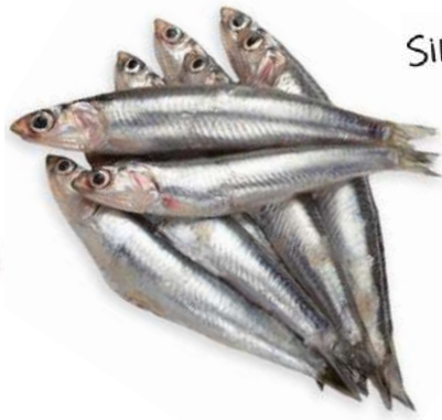
BOQUERÓN ENTERO 50/55