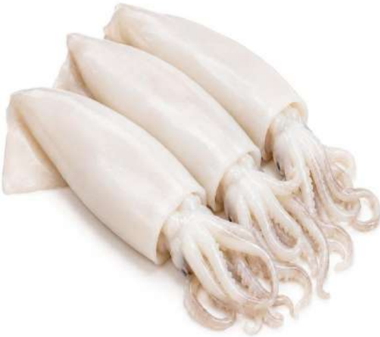
CALAMAR PATAGÓNICO LIMPIO S/PIEL 10/13