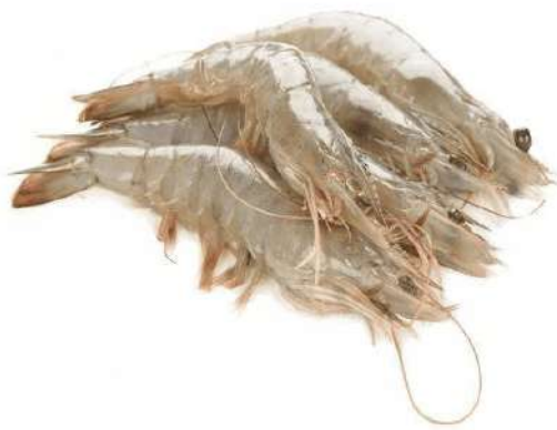
LANGOSTINO VANNAMEI 40/50