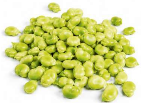
HABITAS SUPER BABY