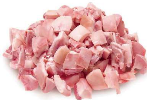
MORRITO DE CERDO COCIDO